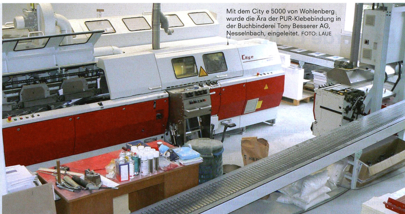
Mit dem City e 5000 von Wohlenberg wurde die Ära der PUR-Klebebindung in der Buchbinderei Tony Besserer AG, Nesselbach, eingeleitet.