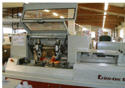
Der Schwingschnitt des Dreischneiders Wohlenberg trim-tec 60i sorgt für die bessere Schnittqualität.

Die Verarbeitung erfolgt per Walzen, weil Besserer verfolgen möchte, wie der Leim aufgetragen wird. Man könne schließlich nicht sehen, ob die Düse verstopft sei. Für die einfacheren Broschüren steht zudem ein Hotmelt-Leimwerk als Wechselsystem zur