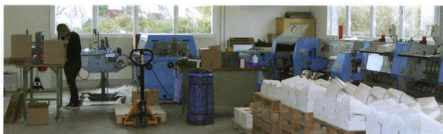
Nach wie vor dient die Buchbinderei auch mit dem Sammelheften und anderen Fertigungsverfahren der Druckweiterverarbeitung.